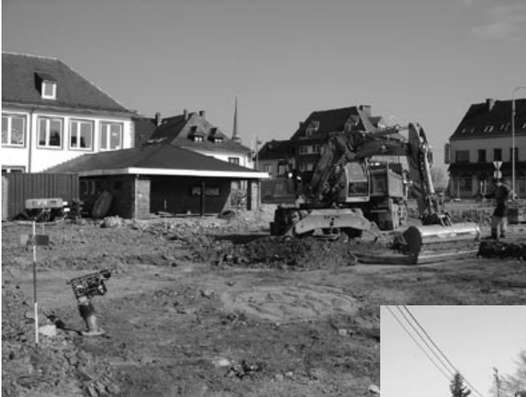
Dieses Bild zeigt die Bauarbeiten der Firma Bodarwé am Windmühlenplatz in St.Vith.

Die Arbeiter der Gemeinde sind derzeit dabei in Hünningen (Weinallee) einen neuen Kanal auf einer Länge von 300 Metern zu verlegen.