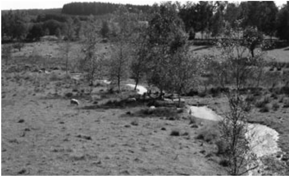
Der Entenbach bei Mailust : eine trügerische Idylle !

Der Stadtrat genehmigte in seiner Sitzung vom 7. Oktober 2004 das Projekt zur Sanierung der Bachläufe Prümer- und Entenbach in St.Vith. Das ehrgeizige Ziel dieses Projektes besteht darin, diese beiden Bachläufe innerhalb der nächsten 2 bis 3 Jahre wieder in einen gesunden Zustand zu versetzen.