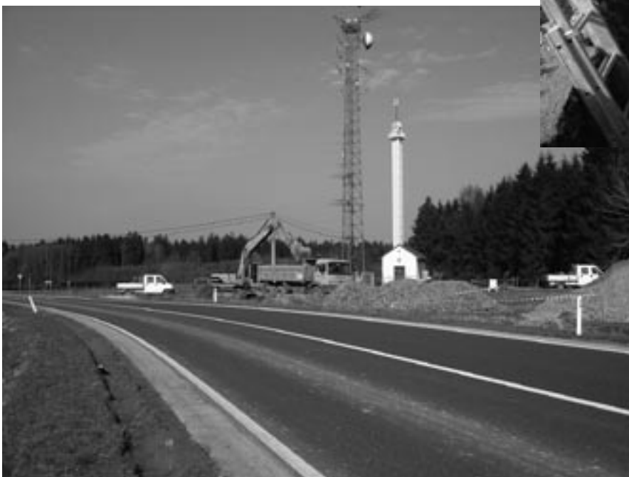
Die Ausschachtungsarbeiten am neuen Hochbehälter (2400 m 3 ) auf dem Tommberg werden derzeit durch die Firma Mertes aus Mirfeld ausgeführt.